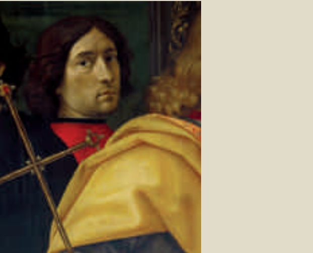
Domenico Ghirlandaio, Madonna col Bambino, Firenze, Galleria Palatina

25 aprile 2011 dalle ore 8.30 Centro Storico di Signa Solenne Corteo Storico in onore della Beata Giovanna. 26 aprile 2011 ore 21 S. Messa concelebrata alla presenza del Sindaco e del Corteo Storico Cerimonia di chiusura dell'urna della Beata. 1 maggio 2011 dalle ore 14 alle 20 Parco dei Renai, Festa del 1 maggio. Info: tel 055 875700 (martedì e sabato ore 9-13; mercoledì, giovedì, venerdì ore 15-19).