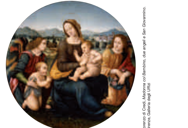
Leonardo di Credi, Madonna col Bambino, due angeli e San Giovanni , Firenze, Galleria degli Uffizi