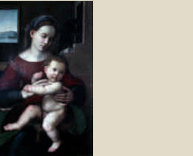
Ritratto del Ghirlandaio, Madonna col Bambino, Firenze, Galleria Palatina

25 aprile 2011 dalle ore 8.30 Centro Storico di Signa Solenne Corteo Storico in onore della Beata Giovanna. 26 aprile 2011 ore 21 S. Messa concelebrata alla presenza del Sindaco e del Corteo Storico Cerimonia di chiusura dell'urna della Beata. 1 maggio 2011 dalle ore 14 alle 20 Parco dei Renai, Festa del 1 maggio. Info: tel 055 875700 (martedì e sabato ore 9-13; mercoledì, giovedì, venerdì ore 15-19).