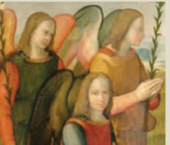
Ritratto del Ghirlandaio, Angeli, particolare, Firenze, Galleria dell'Accademia

Primo lunedì di ogni mese: Saliotto musicale. Secondo lunedì di ogni mese: Saliotto letterario Ass.ne Fro Lastra Enrico Caruso, Via Diaz 6 gennaio 2011 Arrivano i Re Magi Info: tel 055 8725770 (lunedì, mercoledì, venerdì ore 11-13; martedì-giovedì ore 18-20)