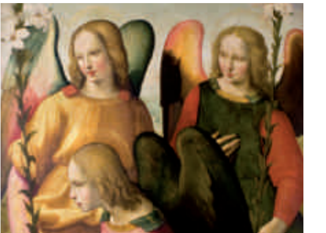
Ritratto del Ghirlandaio, Angeli, particolare, Firenze, Galleria dell'Accademia