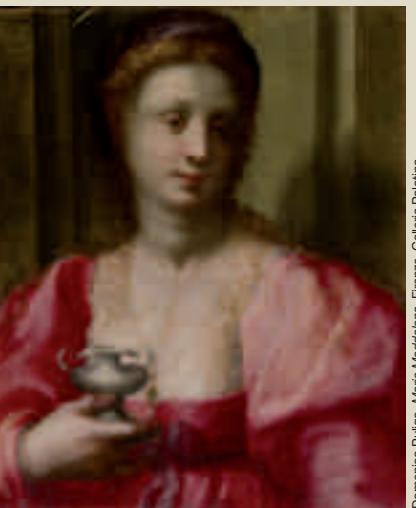
Domenico Puligo, Mirra Addolorata , Firenze, Galleria Palatina

Visite didattiche gratuite alla mostra Per le classi delle scuole primarie e secondarie di primo e secondo grado: visite guidate ai musei del territorio legati all'evento (Museo di Arte Sacra di San Martino a