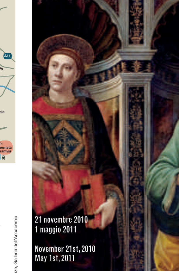
21 novembre 2010 1 maggio 2011 November 21st, 2010 May 1st, 2011

Come arrivare. Da Firenze. Castello dell'Acciaio. Museo di Arte Sacra di San Donnino. Museo di Arte Sacra di San Martino a Gangalandi. Lastra a Signa. Castello dell'Acciaio. Scandicci. Come arrivare. Da Firenze. Castello dell'Acciaio. Museo di Arte Sacra di San Donnino. Museo di Arte Sacra di San Martino a Gangalandi. Lastra a Signa. Castello dell'Acciaio. Scandicci.