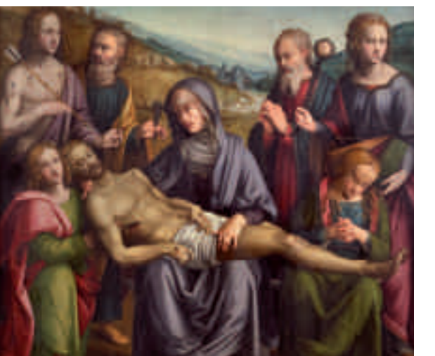
Museo del Complesso di Scandicci, Pietr. Scandicci (FI), Chiesa di San Bernardino in Foto

27 febbraio 2011 Piazza Togliatti. 26 e 27 febbraio 2011, ore 8.30-20 Festa della cioccolata vendita e degustazione di cioccolato Piazza Matteotti. 6 marzo 2011 Piazza V. Veneto. Sfilata di carri allegorici. Info: tel 055 4496235. 20 novembre 2010 ore 21 Villa Castelletti. Concerto di Natale della Filarmonica "G. Verdi". 5 gennaio 2011 ore 21 Giardino dell'Edera, Presepe vivente - Arrivano i Re Magi. 6 gennaio 2011 ore 15 Palestra di Via Calamandrei. Festa della Befana. 11, 18, 25 gennaio 2011, 8 marzo 2011 ore 21 Biblioteca Comunale. Incontro con i grandi poeti della letteratura italiana. 13, 20, 27 febbraio, 6 marzo 2011 dalle ore 15. San Mauro, Carnevale di San Mauro. 20 marzo 2011 ore 9.30 Dalla pieve di San Lorenzo "Signa un museo diffuso di arte sacra". Visita guidata nelle principali chiese di Signa. 24 aprile 2011 Dalla pieve di San Lorenzo alla Pieve di San Giovanni Festa della Beata Giovanna, ore 18.