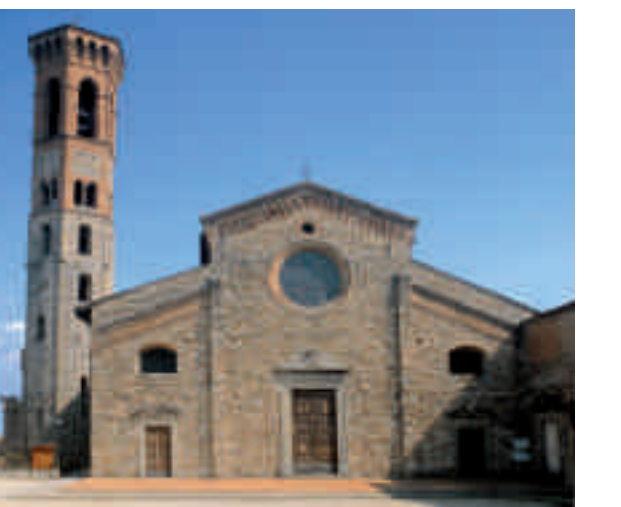
Chiesa di San Salvatore e San Lorenzo a Settimo, Scandicci (FI), Badia a Settimo

Mercato di piante e fiori Piazza Togliatti. 26 e 27 febbraio 2011, ore 8.30-20 Festa della cioccolata vendita e degustazione di cioccolato Piazza Matteotti. 6 marzo 2011 Piazza V. Veneto. Sfilata di carri allegorici. Info: tel 055 4496235. 20 novembre 2010 ore 21 Villa Castelletti. Concerto di Natale della Filarmonica "G. Verdi". 5 gennaio 2011 ore 21 Giardino dell'Edera, Presepe vivente - Arrivano i Re Magi. 6 gennaio 2011 ore 15 Palestra di Via Calamandrei. Festa della Befana. 11, 18, 25 gennaio 2011, 8 marzo 2011 ore 21 Biblioteca Comunale. Incontro con i grandi poeti della letteratura italiana. 13, 20, 27 febbraio, 6 marzo 2011 dalle ore 15. San Mauro, Carnevale di San Mauro. 20 marzo 2011 ore 9.30 Dalla pieve di San Lorenzo "Signa un museo diffuso di arte sacra". Visita guidata nelle principali chiese di Signa. 24 aprile 2011 Dalla pieve di San Lorenzo alla Pieve di San Giovanni Festa della Beata Giovanna, ore 18.