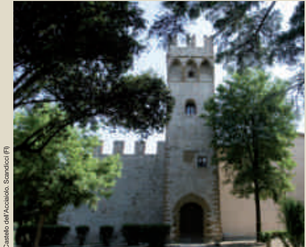
Castello dell'Acciaio, Scandicci (FI)

21 dicembre 2010 Multisala Grotta. Concerto pianistico in onore di Chopin. 27-28 novembre 2010, dalle ore 10 alle 20. 1, 8 marzo 2011 ore 21 Biblioteca Comunale. Incontro con i grandi poeti della letteratura italiana. 13, 20, 27 febbraio, 6 marzo 2011 dalle ore 15. San Mauro, Carnevale di San Mauro. 20 marzo 2011 ore 9.30 Dalla pieve di San Lorenzo "Signa un museo diffuso di arte sacra". Visita guidata nelle principali chiese di Signa. 24 aprile 2011 Dalla pieve di San Lorenzo alla Pieve di San Giovanni Festa della Beata Giovanna, ore 18.